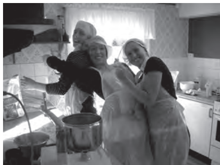
Köksgemenskap på temaveckan

utan snarare att leva i och bli bekräftade i känslan av att höra ihop; ha ett sammanhang där det jag också tillhör i mångfalden och spretigheten. Det är livsviktigt för samhället och demokratins fortlevnad.