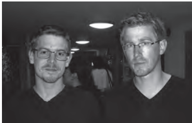
Vem är vem?