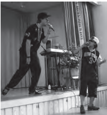
Rapp rappare rappast!