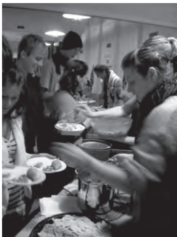
Matkultur med exotiska smaker

Sommarens händelser av våld och död kan bryta ner tron på livet och tilltron till människan. Utanförskap och galna idéer kan leda till så mycket smärta och sorg. Men vi vet något mer, det går att bygga gemenskap, det går att lita på människor och man kan börja om igen! Det är inte det att vi nödvändigtvis ska tycka och tänka likadant